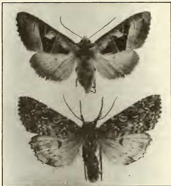
Figuur 3 : (boven) Phlogophora scita Hübner, Le Vic, omgeving Gérardmer (Dep. Vosges, F.), 800 m, 11-vii-1982, leg. W en GDP. (onder) Xestia speciosa Hübner, zelfde gegevens.

Notodonta torva Hübner : 1 ♂, Bois de Merles (Dep. Meuse, F.), 1-viii-1983 (W en GDP); 1 ♂, Côte St.-Germain (Dep. Meuse, F.), 1-viii-1983 (W en GDP).